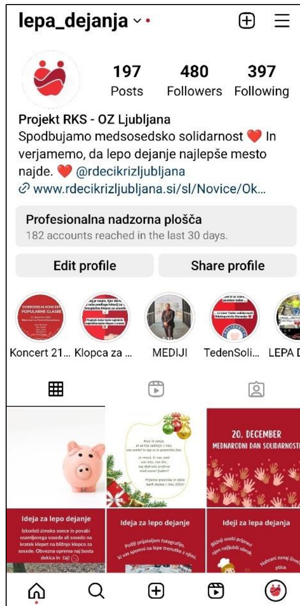
Izgled Instagram profila @lepa_dejanja dne 5. 1. 2024.

Vseskozi smo komunicirali tudi preko Facebook profila @Rdeči križ Ljubljana, ki ima trenutno 1.710 všečkov in 1.836 sledilcev ter IG profila @Rdecikrizljubljana, ki ima 671 sledilcev