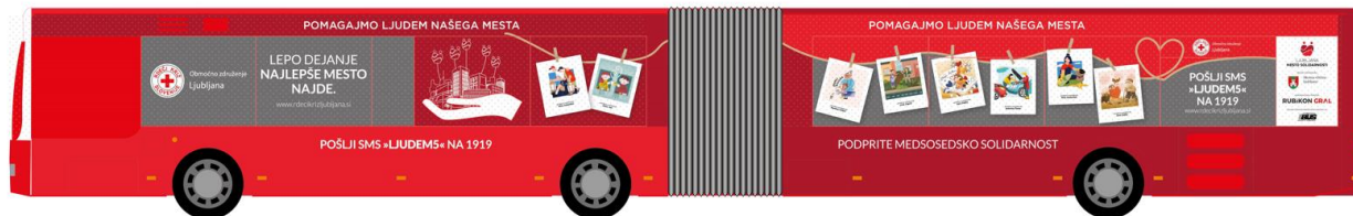
Grafični prikaz avtobusa, ki s celo dvojno levo stranjo širi sporočila solidarnosti.

Sporočila solidarnosti že od leta 2021 nameščamo tudi na mestne avtobuse LPP. V letu 2023 smo imeli na enem avtobusu nameščeno celostransko nalepko (na dvojno levo stran avtobusa), na treh avtobusih pa celostransko nalepko na njihovih zadnjih stranicah.