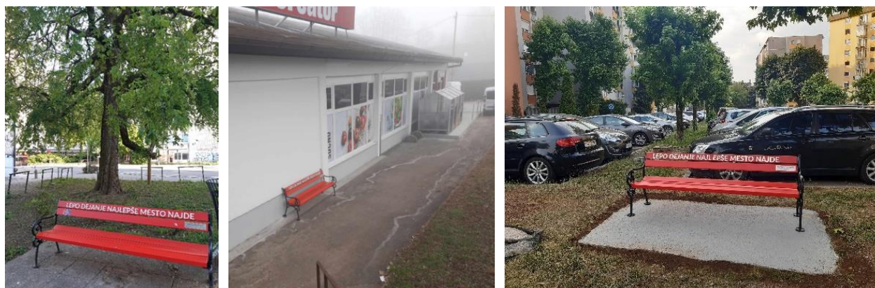
V letu 2023 postavljene klopce ob Vidovdanski, v Srednjih Gameljnah in na Kogojevi ulici.

Skupaj smo do sedaj postavili 13 klopc na različnih lokacijah v Mestni občini Ljubljana in eno na Debelem Rtiču. V letu 2023 smo postavili 3 klopce, in sicer na lokaciji v parku Tabor (na zelenici med Vidovdansko cesto in Ilirsko ulico), pred trgovino Mercator v Srednjih Gameljnah in na Kogojevi ulici v Šiški.