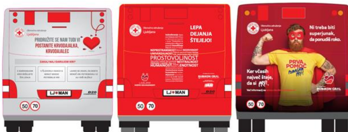
Grafični prikaz treh avtobusov s celostransko nalepko na zadnji stranici avtobusov.

Na grafiki nalepk so ilustracije, ki spodbujajo medsosedsko solidarnost, solidarnost do starejših in solidarnost do okolja. Na grafikah so vključena tudi sporočila solidarnosti s področja krvodajalstva, prostovoljstva, prve pomoči. Skozi celo leto so nas ilustracije in misli solidarnosti spremljale tudi v različnih promocijskih materialih, kot so koledarji in rokovniki RKS-OZLJ.